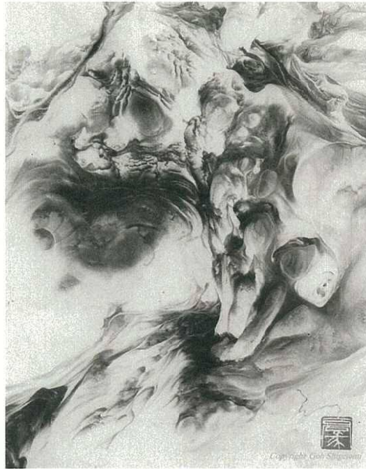
重富 豪氏 作品